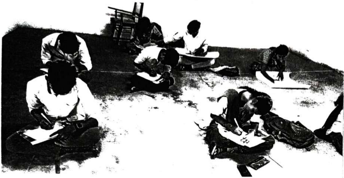
Essay Writing, Election and Postal Presentation Competition for the students.