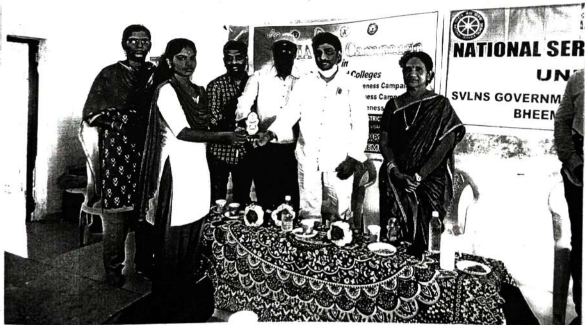
Mementos presented by the Chief Guest to students.